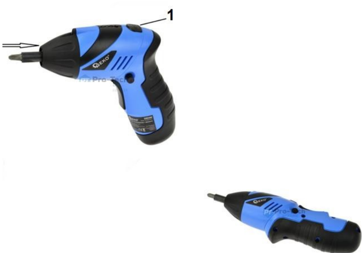
1. Buton de aliniere cu șurubelniță

Dacă lucrați în zone cu probleme sau doriți să găuriți, apăsați butonul și nivelați mânerul în sensul acelor de ceasornic. Acum puteți folosi șurubelnița ca o riglă.